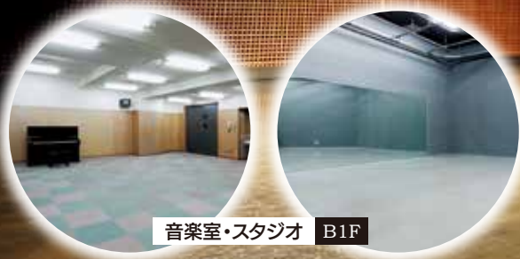
音楽室・スタジオ B1F

目的に合わせて、様々な演出ができるフリーステージを備えた創造空間です。コンサートや演劇、会議、展示会、映画鑑賞会など幅広くご利用いただけます。