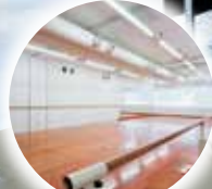
トレーニングルーム 4F